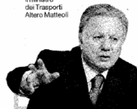
MINISTRO Accanto, il ministro dei Trasporti Altero Matteoli

Qui a lato, la struttura del gruppo Tirrenia: le controllate gestiscono le linee con le isole minori