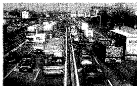
AUTOSTRADE E AEROPORTI

La manovra di dicembre del governo Monti ha previsto che tra le Autorità indipendenti già esistenti sia individuata quella che possa supervisionare il settore dei trasporti. L'Italia ha invece fatto scendere i termini di recepimento della direttiva 2009/12/Ce sui diritti aeroportuali (l'Antitrust chiede modelli di tariffazione non discriminatori)