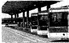
SERVIZI PUBBLICI LOCALI