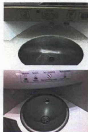
Il lavabo del Frecciarossa in finto marmo (sopra); sotto quello di Italo. Entrambi carini, ma nel primo la pulizia lascia un po' a desiderare.

Il pasto sul Frecciarossa (sopra) al tavolo e con posate vere. Su Italo (sotto), invece, il pasto viene servito al proprio posto in una scatola come in aereo. Qualità buona in entrambi i casi.