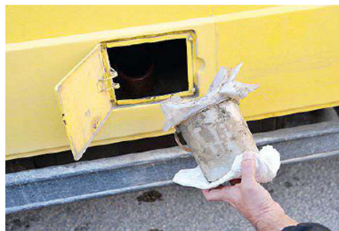
Il tappo rotto al serbatoio di uno scuolabus di Teramo (foto del 2014)

si la metà dei veicoli ha oltre 14 anni, mentre Corropoli, Controguerra, Morro d'Oro, Castellato e Pineto possiedono pulmini vecchi di 20 anni. In merito al prezzo l'80% dei Comuni chiede alle famiglie un contributo spese, ad eccezione di Arsita, Corropoli, Cermignano, Castel Castagna, Castiglione Messer Raimondo, Castilenti, Controguerra, Rocca Santa Maria e Penna Sant'Andrea che offrono il servizio gratuitamente. Seguono Basciano e Tossicia con una retta di 10 euro, mentre il resto dei Comuni chiede tra i 20 e i 180 euro. Maglia nera a Teramo dove la retta massima arriva a 360 euro. Inoltre il 35% delle amministrazioni non richiede l'Isce