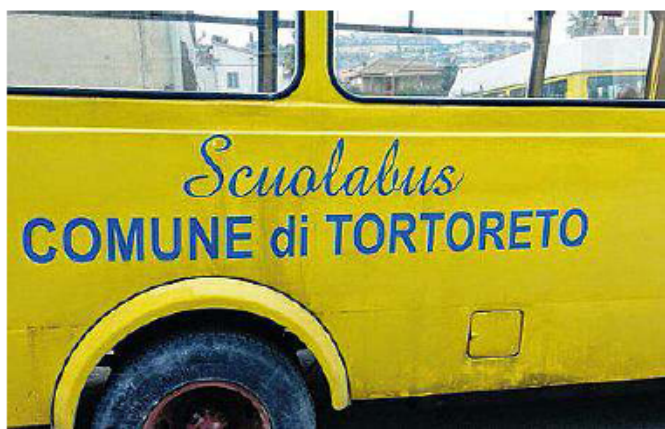
Un vetusto scuolabus di Tortoreto (la foto è dell'anno scorso)

I NUMERI. Diecimila sono gli alunni interessati dal servizio, fra infanzia, elementari e medie, e se a Cermignano e Tossicia i fruitori dello scuolabus rappresentano il 100% della popolazione scolastica, a Teramo la percentuale scende al 17%. Per quel che riguarda il capitolo veicoli, in provincia sono 200 i pulmini gialli in circolazione, 3 su 4 di proprietà dei Comuni. Roseto ha il maggior numero di mezzi, 15, seguito da Giulianova con 12 pulmini, Teramo e Silvi con 10 fino ad arrivare a Rocca Santa Maria con un solo mezzo. Qua-